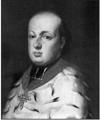
Kurfürst Max Franz

Mitte des 11. Jahrhunderts ging Rheinbreitbach (als Teil der Pfarrei Unkel) in den Besitz der Kölner Kirche über. Die Erzbischöfe und Kurfürsten von Köln als geistliche und weltliche Herrscher kümmerten sich nur wenig um diese „Winkelschulen“ und die darauf aufbauenden Gymnasien und Lateinschulen. Ihnen war das Renommee „ihrer“ Universitäten wichtiger, weshalb sie Geld für Bildung — wenn überhaupt — auch nur dort investierten.